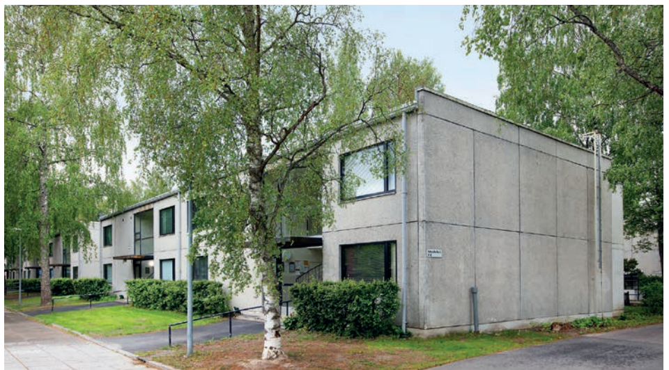
Asunto Oy Siltapaju

Tässä ryhmäkorjaushankkeessa rakennukset ja talojen huoneistot ovat hyvin samankaltaisia ja siten teollisilla esivalmisteisilla moduuleilla helposti toteutettavissa. Näin